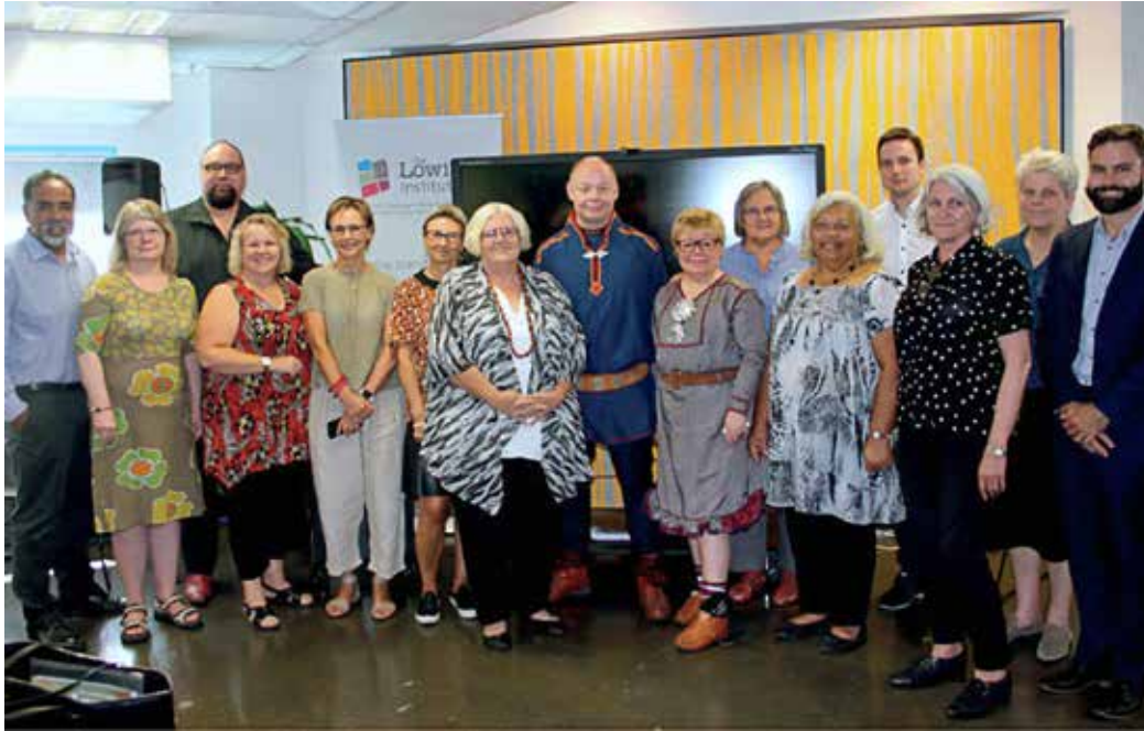
Lowitja Institute og Univeristy of Melbourne arrangerte i 2016 et eget seminar for flere av Etikktvalgets medlemmer og representanter fra Sametinget om etiske retningslinjer for helseforskning vedrørende aborginsk og Torres Strait Islander befolkningen i Australia.

også er kulturelt betinget (86). Å legge til grunn et krav om kollektivt samtykke kan stimulere til en diskusjon om lokale etiske betraktninger. Dette skal ikke oppfattes som at urfolk ikke stiller seg bak for eksempel Helsinkideklarasjonen, men heller det at urfolk kan ha etiske overbevisninger som kommer i tillegg til de som fremgår av Helsinkideklarasjonen. I flere av dokumentene anmodes det om at lokal etisk overbevisning bør respekteres.